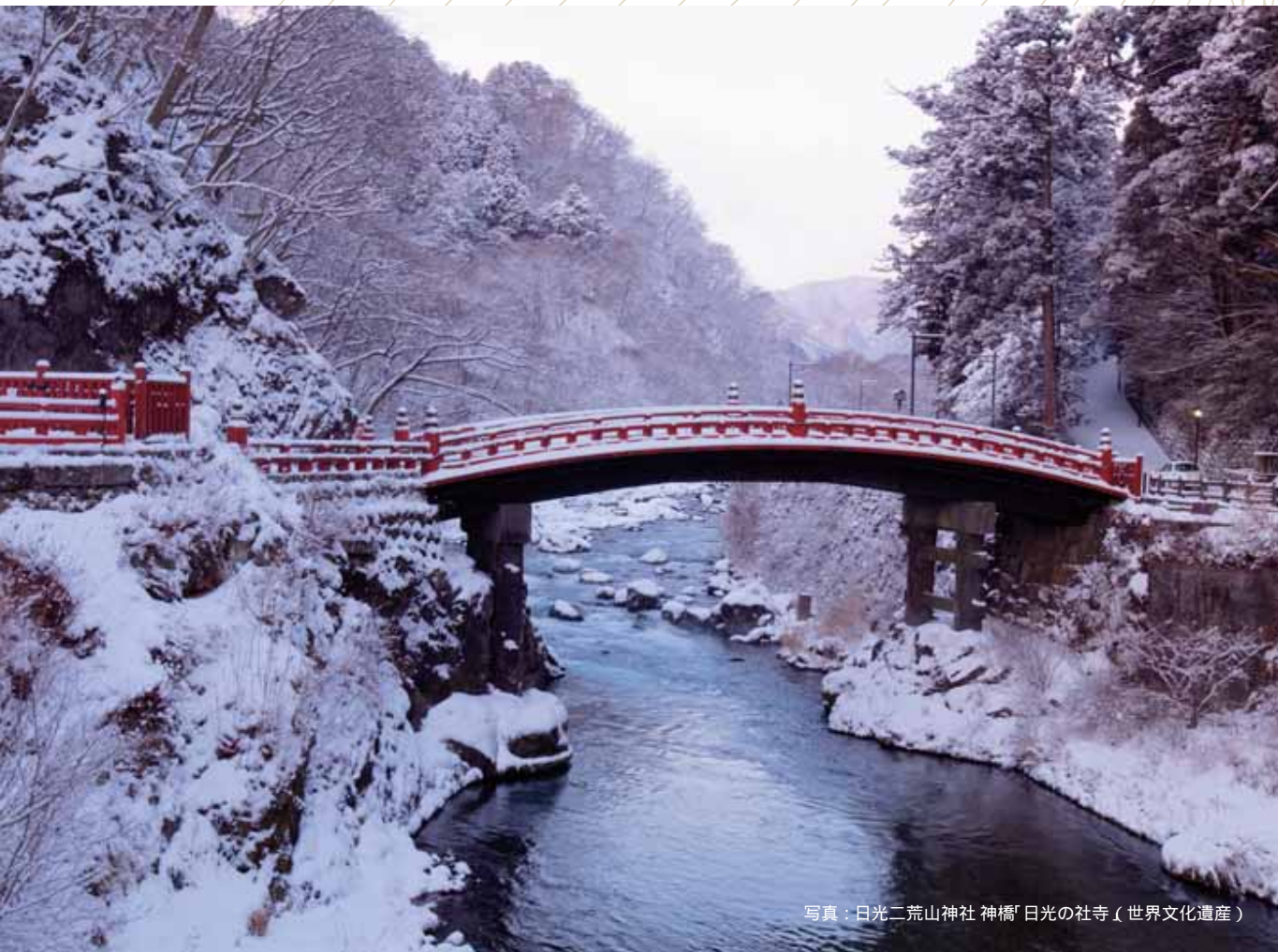
写真：日光二荒山神社 神橋 日光の社寺（世界文化遺産）